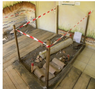
Musée - salle 1, reconstitution de petits secteurs de fouille