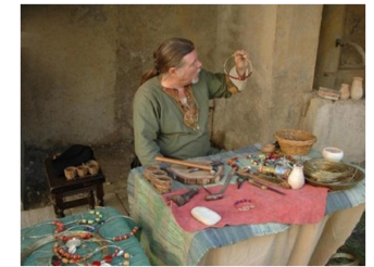
L'orfèvre - Les Voyageurs du Temps