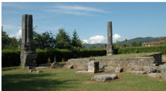
Temple gallo-romain d'Izernore

A quelques pas du musée, subsistent les vestiges d'un temple, seuls témoins visibles de l'architecture monumentale gallo-romaine d'Izernore.