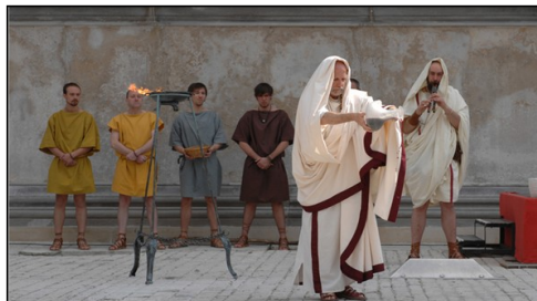
Invocation des dieux - Les Voyageurs du Temps www.voyageurs-du-temps.fr

Izernore redevient Isarnodurum le temps d'un week-end !